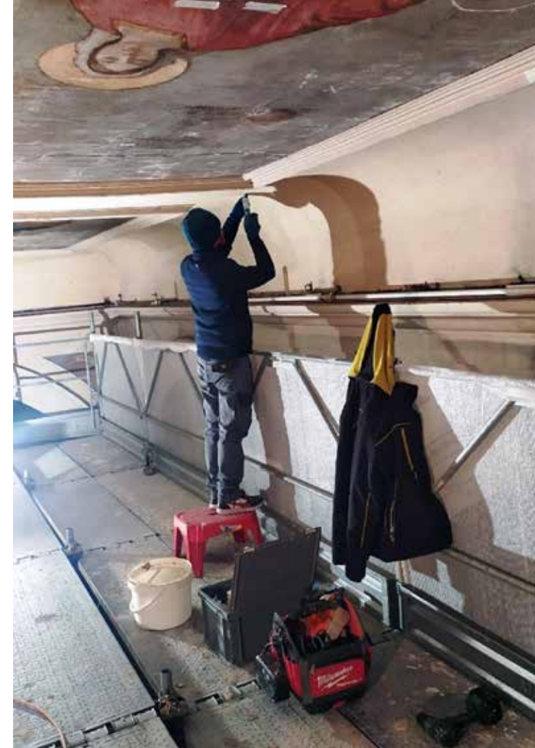
Tetto Lavori interni restauro Navata sud.