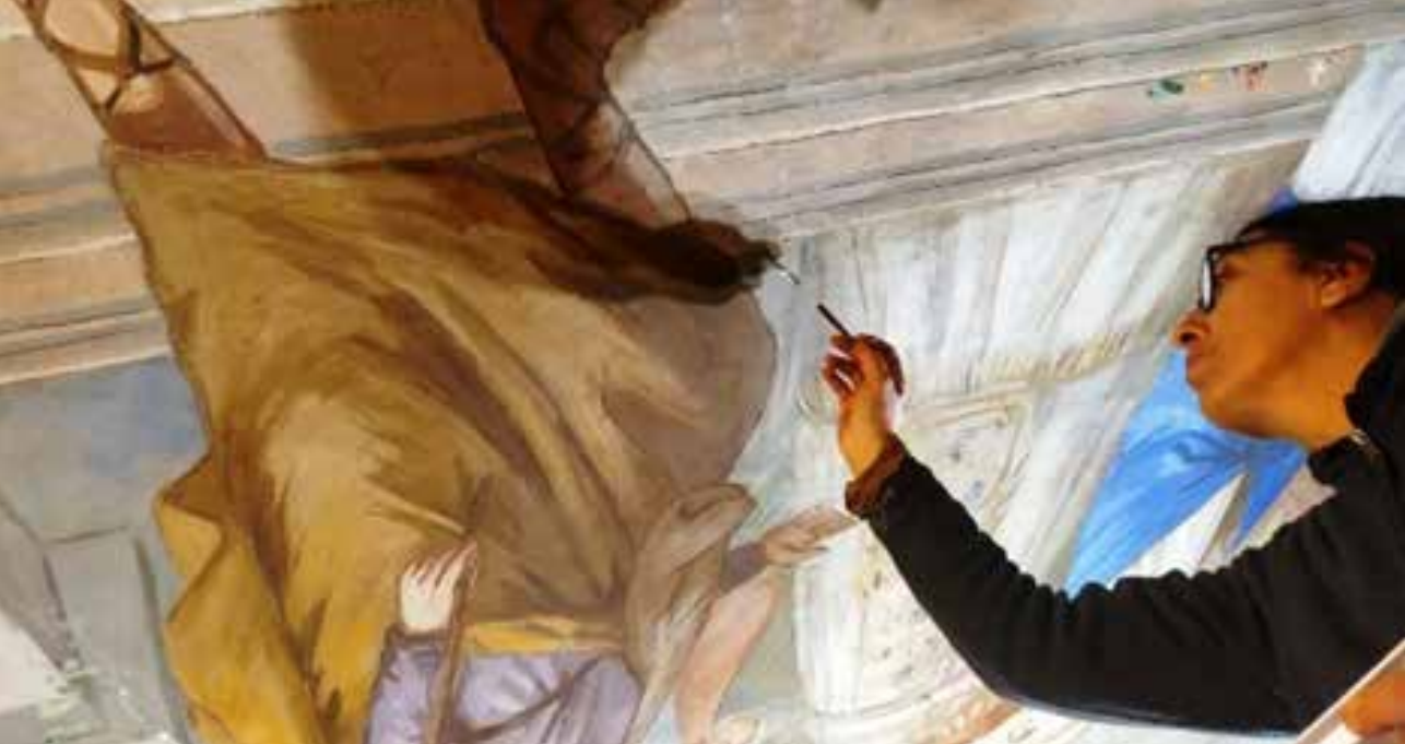
Tetto Lavori interni e restauro Navata sud.