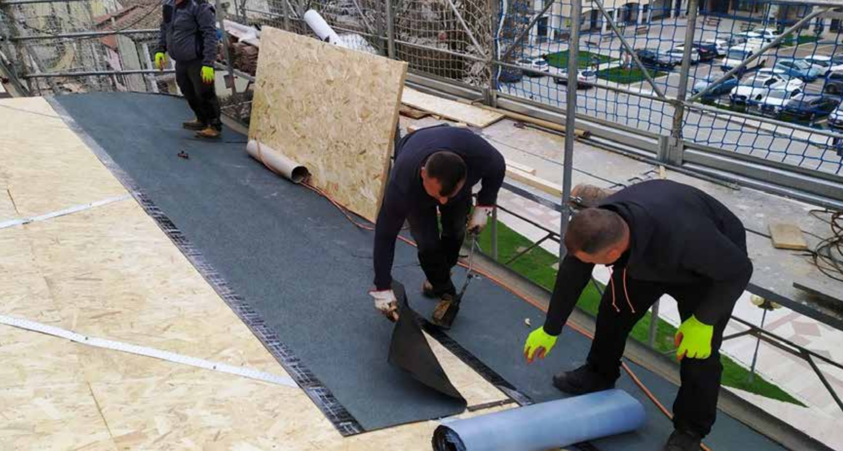
Tetto Lavori esterni, posizionamento guaina, ripasso delle tegole.