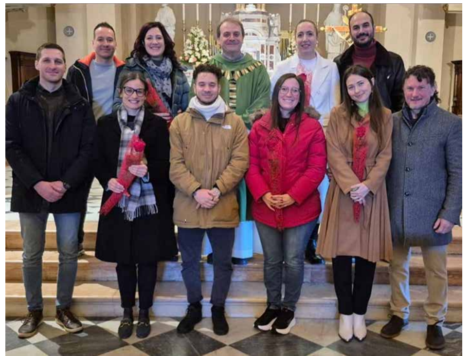
PRESENTAZIONE DEI FUTURI SPOSI DEL 2026 - 1 Febbraio 2026 BATI MARSO DELLA SCUOLA DELL'INFANZIA - 27 febbraio 2026