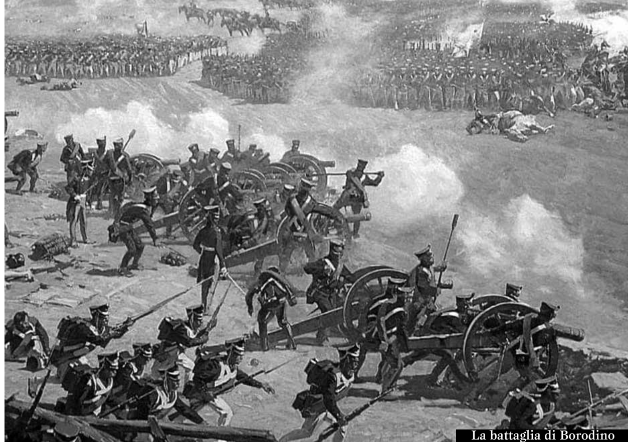
La battaglia di Borodino

In sintesi, i russi vinsero non con una singola battaglia, ma con una guerra di logoramento e di resistenza, sfruttando il proprio territorio, il clima e la determinazione a non arrendersi, trasformando la campagna in un disastro totale per Napoleone.