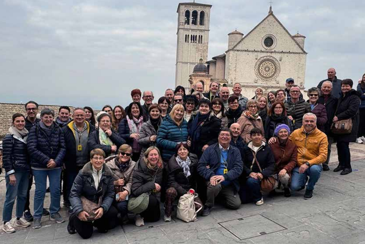
PELEGRINAGGIO AD ASSISI PER L'OSTENSIONE DEL CORPO DI SAN FRANCESCO 28 Febbraio - 1 Marzo 2026 BENEDIZIONE DEI BAMBINI BATTEZZATI NEL 2025 - 8 Febbraio 2026