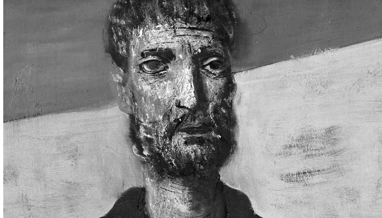
Ritratto di San Francesco di Candido Portinari

La sua azione si muove da un impulso positivo, dalla volontà di offrire l'esempio di una vita vissuta cristianamente, come l'ha vissuta Gesù Cristo, in altre parole riproporre l'esperienza di Cristo, documentata dal Vangelo. Cristo ha vissuto nella povertà e si è sacrificato per amore degli uomini. Povertà e amore sono i due valori fondamentali predicati dal santo, la povertà, anzi, è stata per lui una scelta di vita.