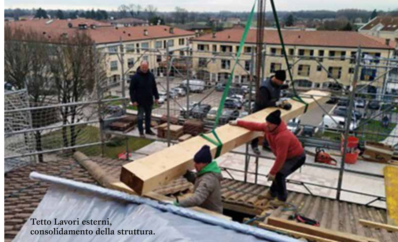
Tetto Lavori esterni, consolidamento della struttura.