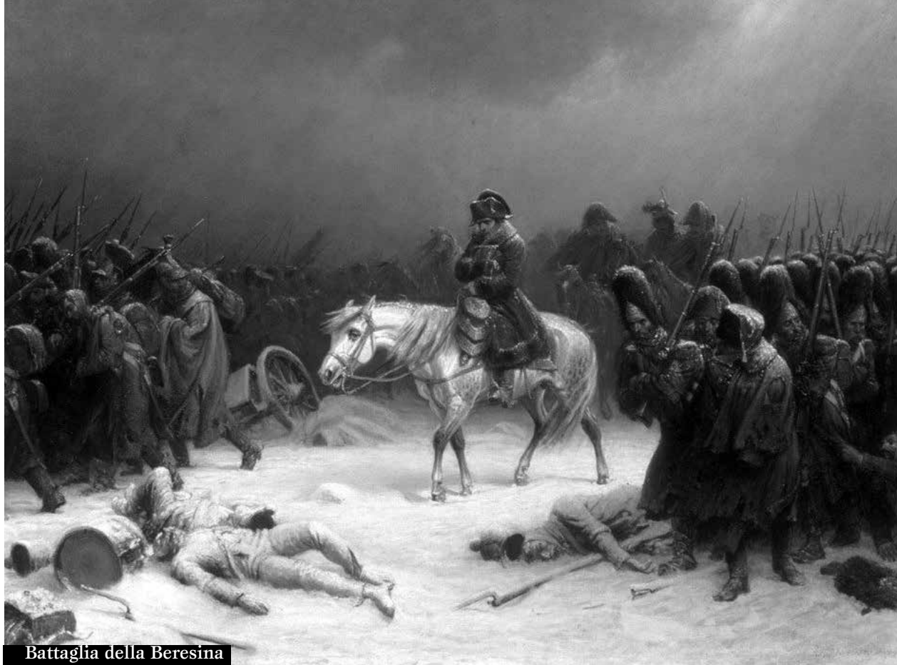
Battaglia della Beresina

Dalla fine del settecento con la Serenissima, al periodo napoleonico le tasse aumentarono del 780%. Particolarmente odiosa la tassa sul macinato, il dazio della macina, una vera e propria tassa sulla fame che colpiva i nostri contadini al momento